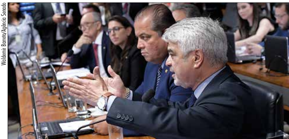
Senadores Humberto Costa e Eduardo Gomes em reunião da CPI mista que investiga notícias falsas