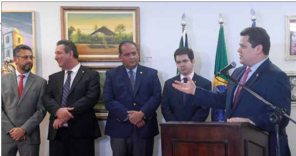
Clécio Luís, Lucas Barreto, Eduardo Gomes e Randolfe Rodrigues ouvem o presidente do Senado, Davi Alcolumbre