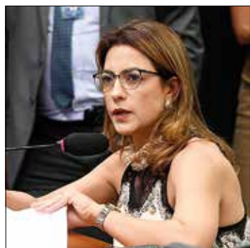
A audiência foi solicitada pela senadora Soraya Thronicke

debate a ex-ministra do Meio Ambiente e Copresidente do Painel Internacional de Recursos da ONU Izabella Teixeira, o secretário especial de Comunicação Social da Presidência da República, Fabio Wajngarten; e representantes dos ministérios das Relações Exteriores, da Agricultura e do Meio Ambiente.