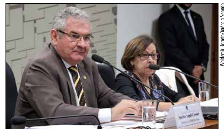
Angelo Coronel e Lídice da Mata participam de reunião da CPI mista

Presidida pelo senador Ângelo Coronel (PSD-BA), a CPI mista tem 180 dias para investigar perfis falsos e ataques cibernéticos nas redes sociais, inclusive aqueles com possível influência no processo eleitoral.