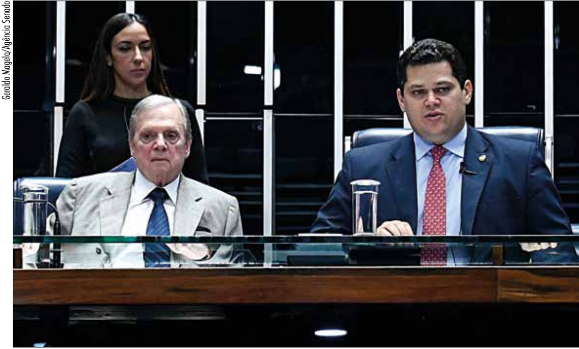
O relator da proposta, Tasso Jereissati, participa da sessão temática ao lado do presidente Senado, Davi Alcolumbre

Em sessão temática ontem, senadores e convidados falaram contra e a favor da reforma. Debate também contou como sessão inicial de discussão da PEC paralela