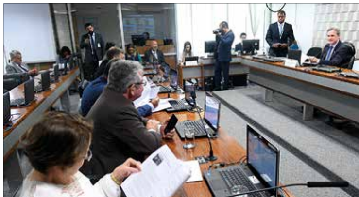
Dário Berger (D) preside reunião para análise de projetos na comissão

De acordo com o senador, as escolas só vão fazer carteiras de alunos regularmente matriculados, o que reduz a possibilidade de fraude.