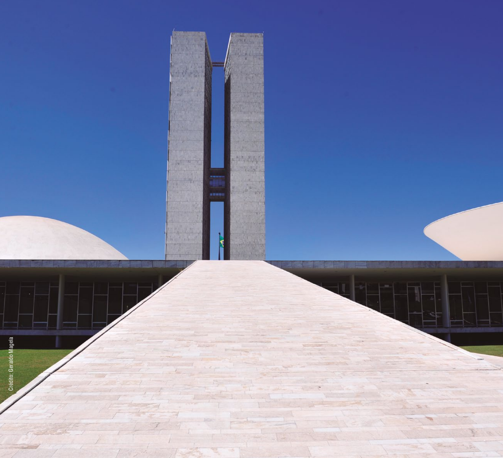
Crédito: Geraldo Magela