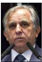
Jefferson Rudy/Agência Senado

— Há escritórios hoje com multas de R$ 1 milhão, R$ 2 milhões, R$ 3 milhões e os contadores não têm nem como cobrar das empresas.