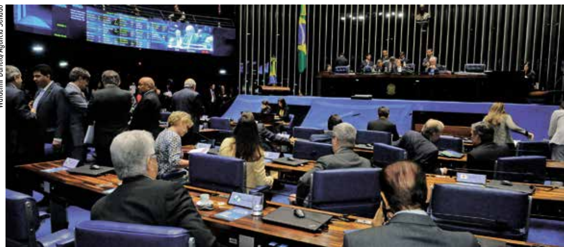
Senadores durante a sessão em que aprovaram projeto de resolução que derruba regra do Ministério da Saúde

— Afinal, não há argumentação lógica cabível para justificar a existência de diferentes fontes de financiamento para um mesmo tipo de procedimento — ressaltou.