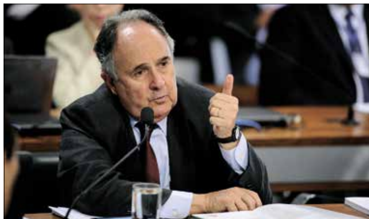
Relator, Cristovam Buarque diz ser fundamental investir mais em creches

O Fundeb é formado por 20% de um conjunto de impostos. As redes estadual e municipal