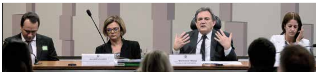
Senador Waldemir Moka (3º à dir.) preside audiência pública da Subcomissão de Doenças Raras

— O registro de desabastecimento, na imensa maioria das vezes, se refere a medicamentos que ainda não foram incorporados ao SUS. Portanto, ainda não fazem parte da Política Nacional de Assistência Farmacêutica do Ministério da Saúde.