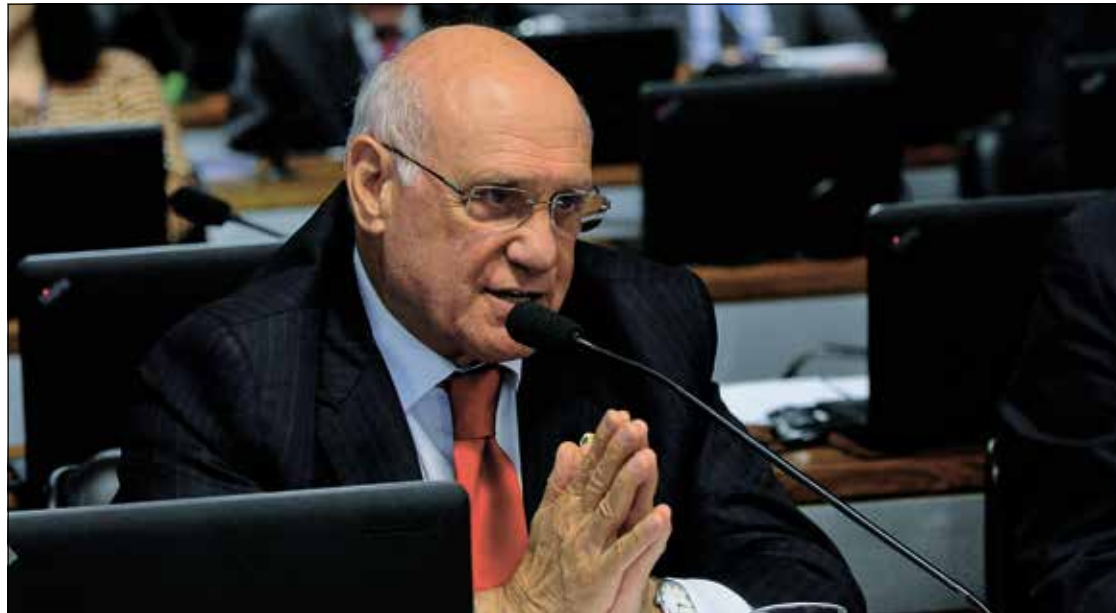
Lasier busca solucionar impasse criado por leis estaduais que obrigam empresas de telefonia a custear bloqueio

Originalmente, o projeto sugeria a cobertura desses serviços com recursos do Fundo de Fiscalização das Telecomunicações (Fistel). Lasier argumenta que é de interesse