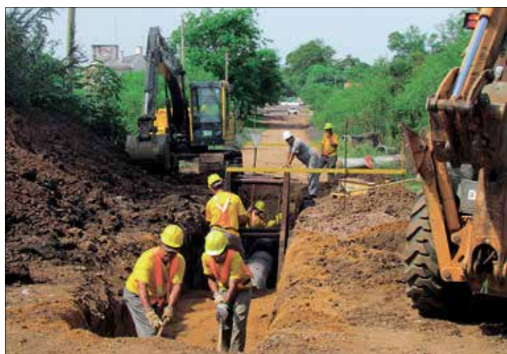
Fundo para PPPs vai financiar obras de infraestrutura urbana no país

A lei trata de outro assunto de interesse de senadores e deputados. O texto atribui aos ministros a decisão de indicar quais emendas parlamentares ao Programa de Aceleração do Crescimento (PAC) serão de transferência obrigatória para