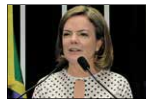
Waldemir Barreto/Agência Senado