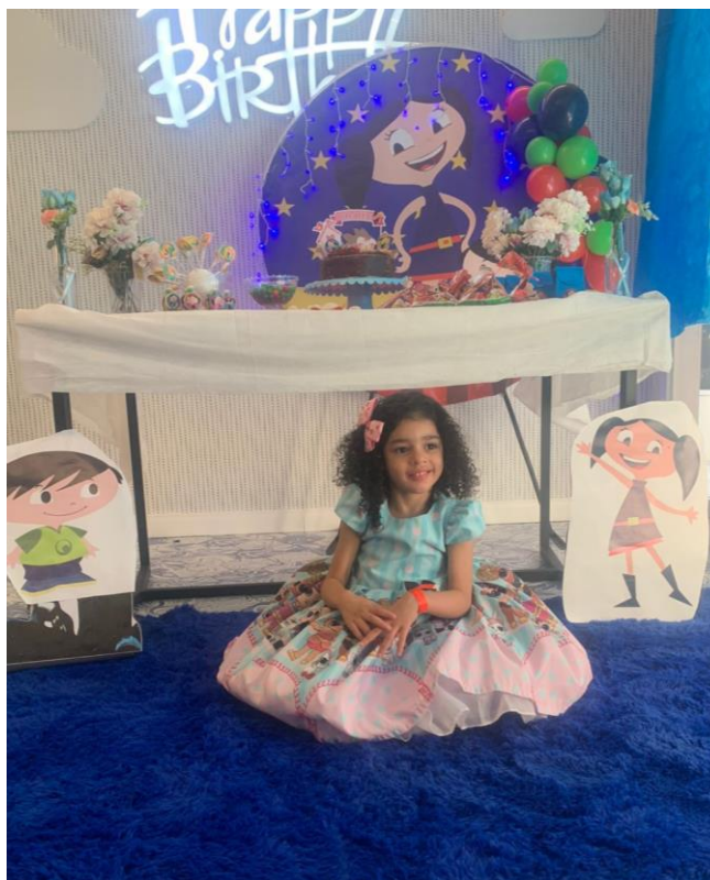
Luna Diagnóstico: Autista e Microcefalia