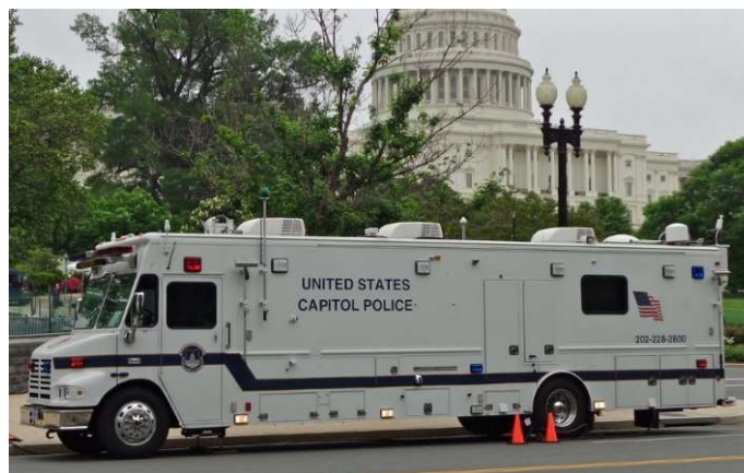
United States Capitol Police