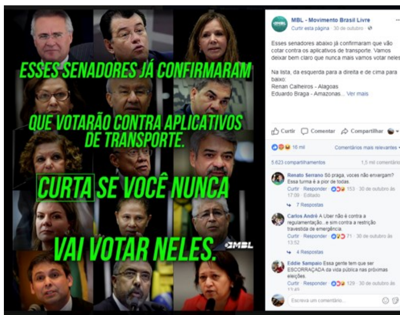
Figura 1 - Post do Facebook - Página MBL – Exemplo de Fake News

Calheiros, Eduardo Braga, Vanessa Graziotin, Lídice da Mata, Fernando Pimentel, Hélio José, Lúcia Vânia, João Alberto Souza, Humberto Costa, Gleise Hoffman, Regina Sousa, Roberto Requião, Lindbergh Farias, Paulo Paim e Fátima Bezerra.