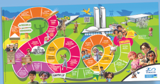
Jogo Na Trilha da Cidadania