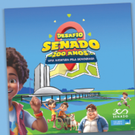
Pasta do projeto