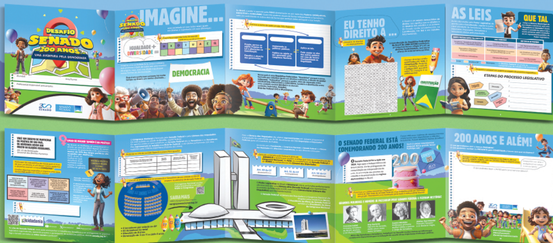
Material do Aluno - Sequência Didática

Todos os materiais do projeto Desafio Senado 200 anos: uma aventura pela democracia estão disponíveis no link abaixo, inclusive em texto para leitores de tela e em áudio.