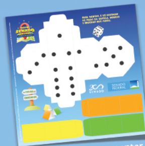
Dado do jogo para montar