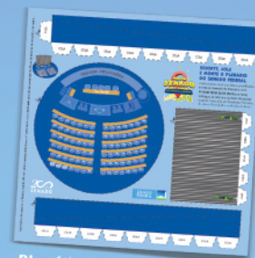
Plenário do Senado Federal para montar