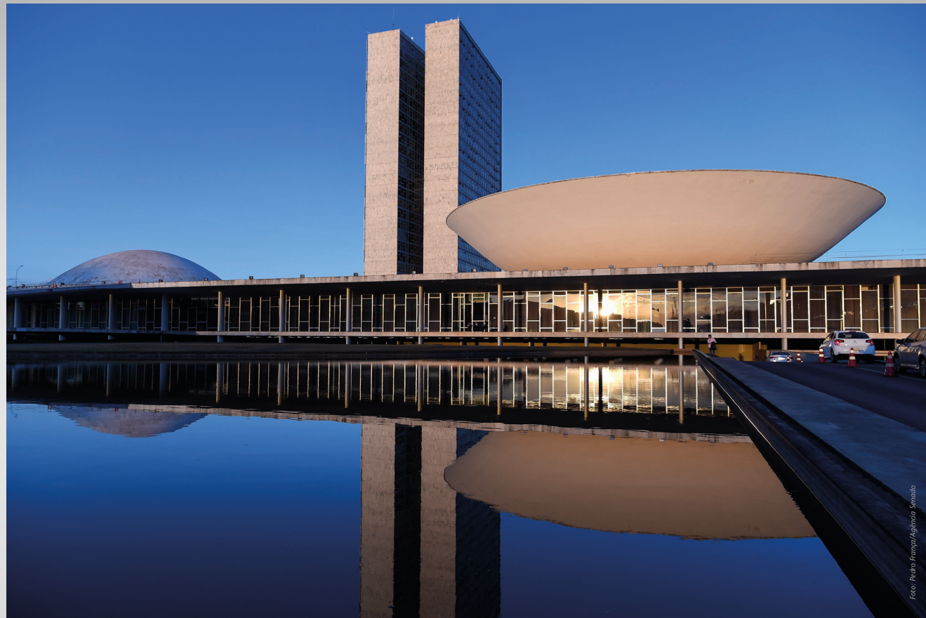
Fachada del Congreso Nacional al atardecer.

El proceso legislativo comprende la elaboración de Enmiendas a la Constitución; Leyes complementarias; Leyes ordinarias; Leyes delegadas; Medidas provisionales; Decretos legislativos y Resoluciones