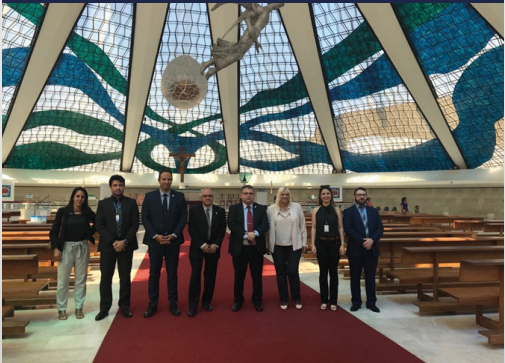
Delegación de Israel conoce la Catedral de Brasilia.

"No tengo duda de que fue la decisión correcta de venir aquí. Este primer encuentro fue importante por la relación personal y de trabajo." Sobre Brasilia, él dijo: "Es una vista única. Distinta de cualquier capital que haya visitado."