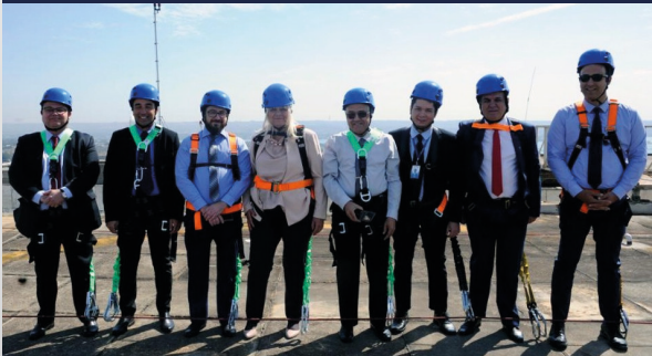
Comitiva de Israel con chalecos de seguridad subiendo a la cima del anexo 1 de la Cámara de Diputados