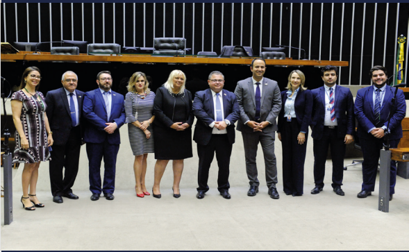
Delegación de Israel visita La Cámara de Diputados