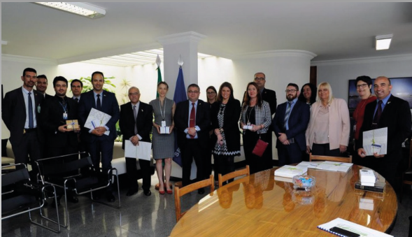
La Comitiva israelí se reúne con la Directora General del Senado Federal y servidores que participarán en la Primera Reunión de la Alta Administración de los Parlamentos de Israel y Brasil.