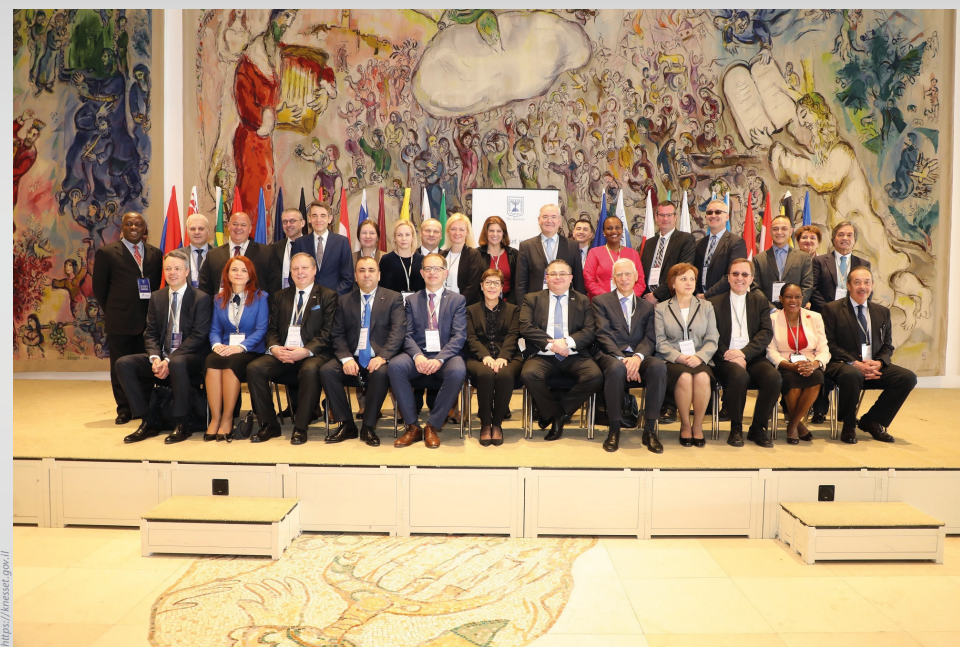
Foto oficial de los participantes de la Conference for Heads of Parliamentary Administration, realizada este año en Jerusalén.

Los representantes brasileños participaron de un debate internacional durante la Conference for Heads of Parliamentary Administration, que reunió a 29 países. En la ocasión, se presentaron las iniciativas adoptadas en el Senado y la Cámara de Diputados para la accesibilidad de personas con discapacidades, además de los proyectos ambientales y de equidad de género.