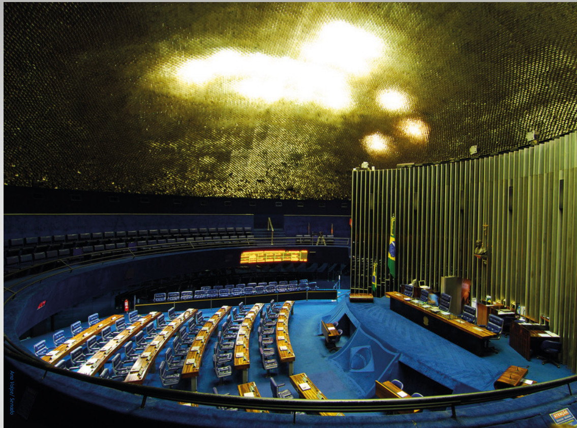
Plenário do Senado

Entre los otros órganos del Senado, están los bloques parlamentarios, los líderes, la Asuntos Internos, la Oidoría, los procuradores, los foros, los consejos, las frentes parlamentarias y los grupos.