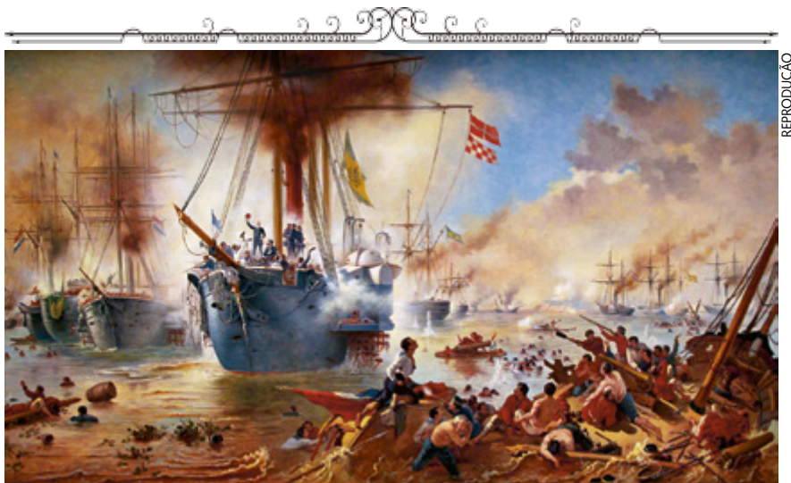
Pintura de Victor Meirelles retrata a Batalha do Riachuelo, um dos embates decisivos da Guerra do Paraguai

A guerra derivou das tensões diplomáticas na região do Rio da Pra-