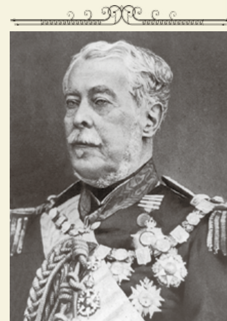
Caxias: senador atuou na guerra

Caxias era um militar brilhante, célebre por sufocar movimentos revoltosos como a Balaiada, no Maranhão, e a Revolução Farroupilha, no Rio Grande do Sul. Quando foi convocado para comandar as tropas na Guerra