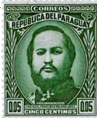
O mariscal Solano López aparece como herói em selo dos correios do Paraguai