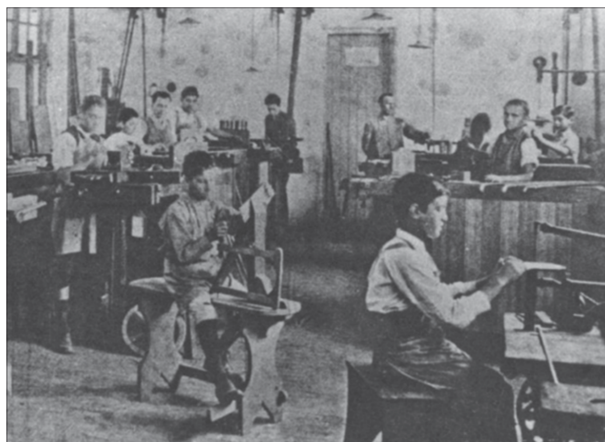
Crianças trabalham em fábrica de sapatos no início do século 20: em 1927, a atividade dos menores de 12 anos ficou proibida

Extenso e minucioso, o código se dividia em mais de 200 artigos, que iam além da punição dos pequenos infratores. Norma-