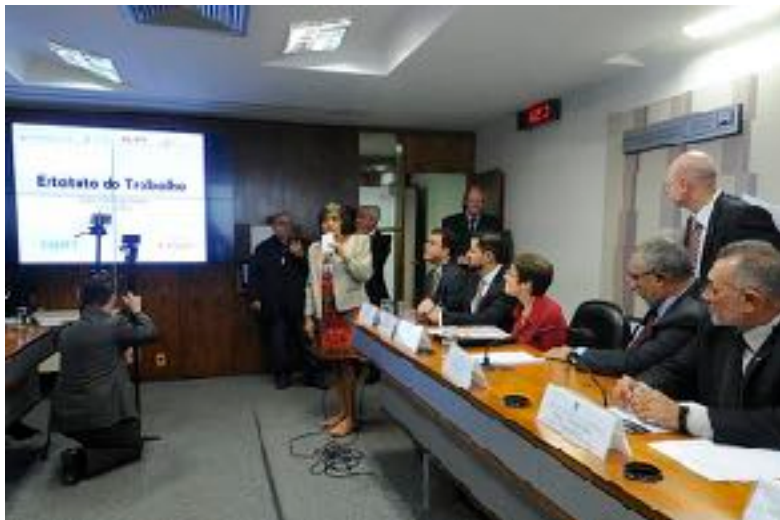
RE Nº 7-CDHET - 10/05/18

As imagens a seguir ilustram as atividades da comissão no Biênio (2017-2018)